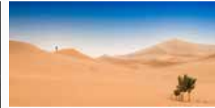
Laurent MOREAU Photographe (78)