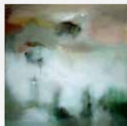
Isabelle ISTE Peintre (28)

Entrée libre Lundi et Mercredi : 10h - 12h et 14h - 18h Samedi : 10h - 12h