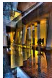
Michel DELFELD Photographe, arts numérique (Belgique)