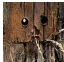
Michel VERNA Photographe (95)