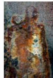
Jean-Michel RIPAUD Photographe (95)