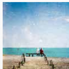
Françoise HILLEMAND Photographe (75)