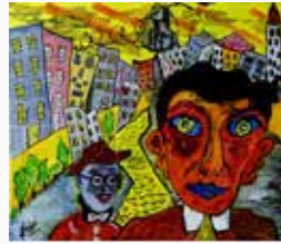
Denise GRISI Peintre (46)