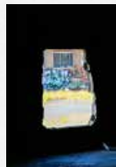
Denis BRUNEAU Photographe (45)

Entrée libre : 10h - 18h les Jeudis 5, 12, 19, 26 mai et 2, 16, 23 et 30 juin Lundi 16 mai, Dimanche 22 mai les Samedis 21 mai et 11 juin et sur rendez-vous